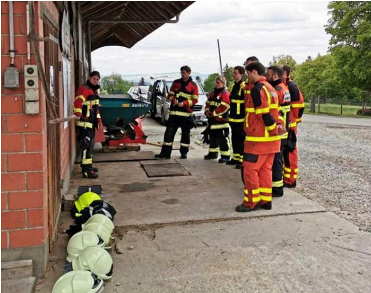
Einstieg in die Brandbekämpfung

Der Gruppenführer soll erlernen, wie er eine Gruppe im Einsatz führen kann. Er kann nach dem Kurs Ausbildung auf der Basis des Reglements Basiswissen betreiben. Der angehende Gruppenführer erhält ein Grundgerüst in Methodik und Didaktik. Alle haben den EK Gruppenführer mit Erfolg bestanden. Wir gratulieren.