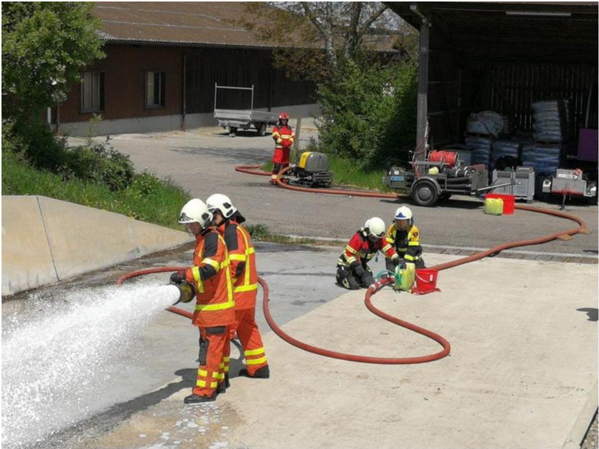
Aufbau einer Schaumleitung