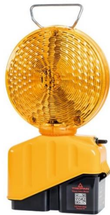
Helios Master (optional auch als Lauflicht)