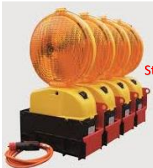
Nissen Star-Flash 627 4er Set

Helios Master: 660 cd, à CHF 140.- Erfüllt die Klasse L8L der Norm 12352 250 Stunden mit zwei 6V Blockbatterien